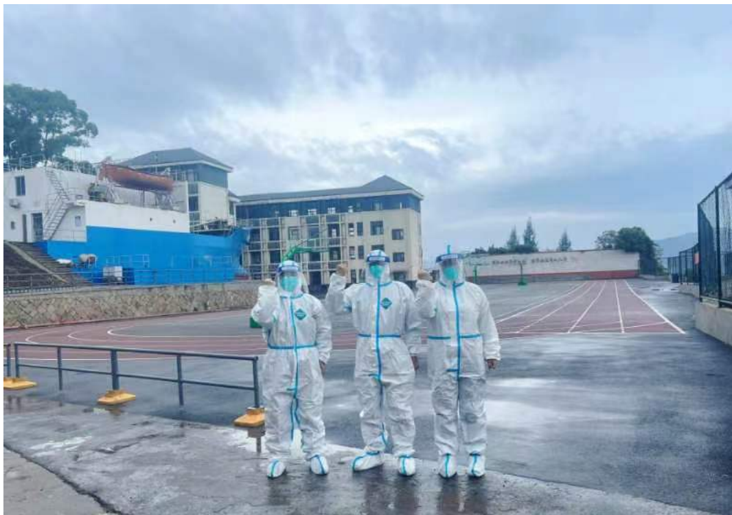
图 1：党员干部冲锋在前，奋战“疫”线，勇担使命