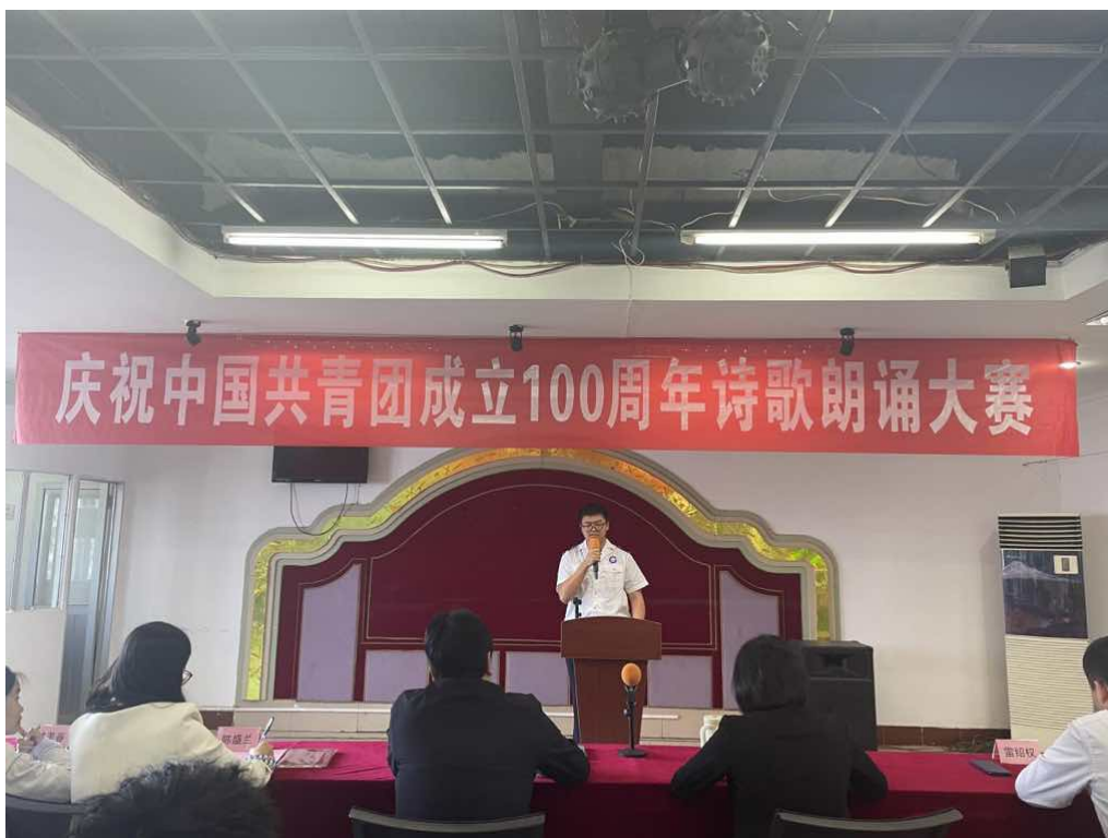
图 6：举办“不忘初心，强国有我”诗词朗诵大赛