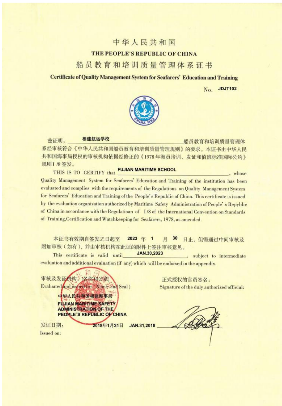
图 19：学校《中华人民共和国船员教育和培训质量体系证书》

质量管理体系能够连续、有效地运行，本次换证审核予以通过，建议主管机关给予换发该学校《质量管理体系证书》。