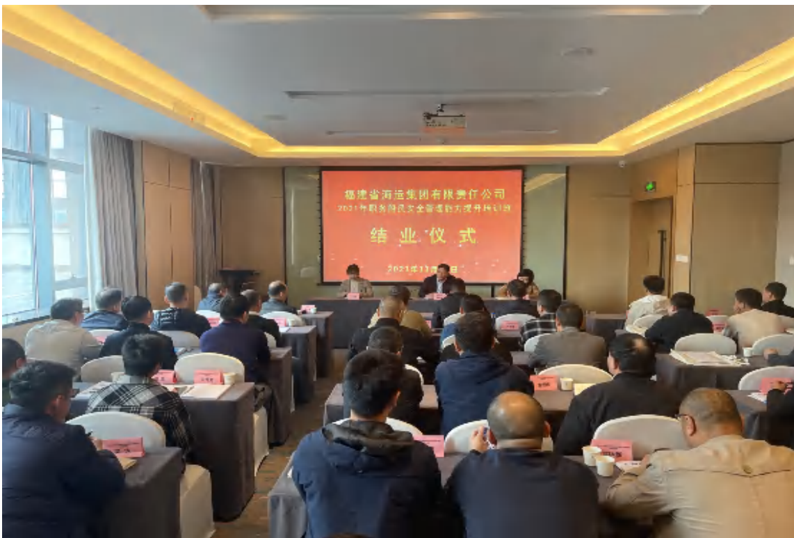
图 14：“职务船员安全管理能力提升培训班”结业仪式

海运集团领导高度认可学校的培训安排，认为学校做出的培训课程安排紧凑、内容专业务实，学习氛围很浓厚。集团组织公休职务船员参加培训，目的是提升船员的安全管理能力和履职能力，也为交流提供了一个良好的机会。