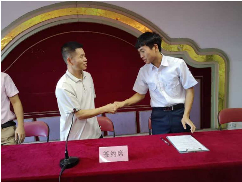
图 17: 签订《就业意向书》