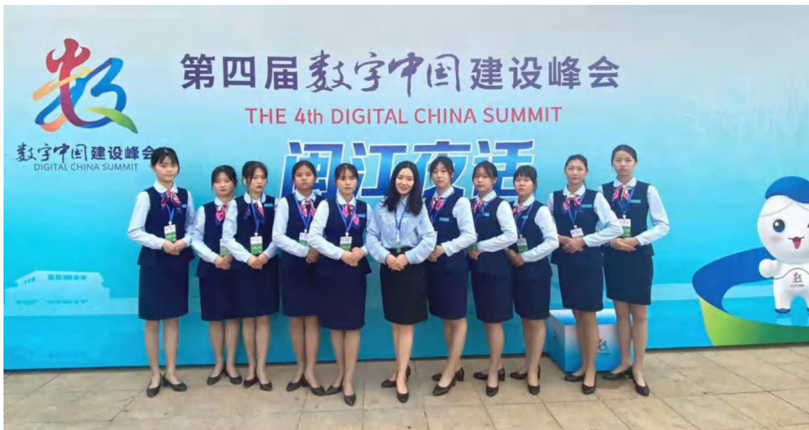
图 15：“第四届数字中国建设峰会”服务工作