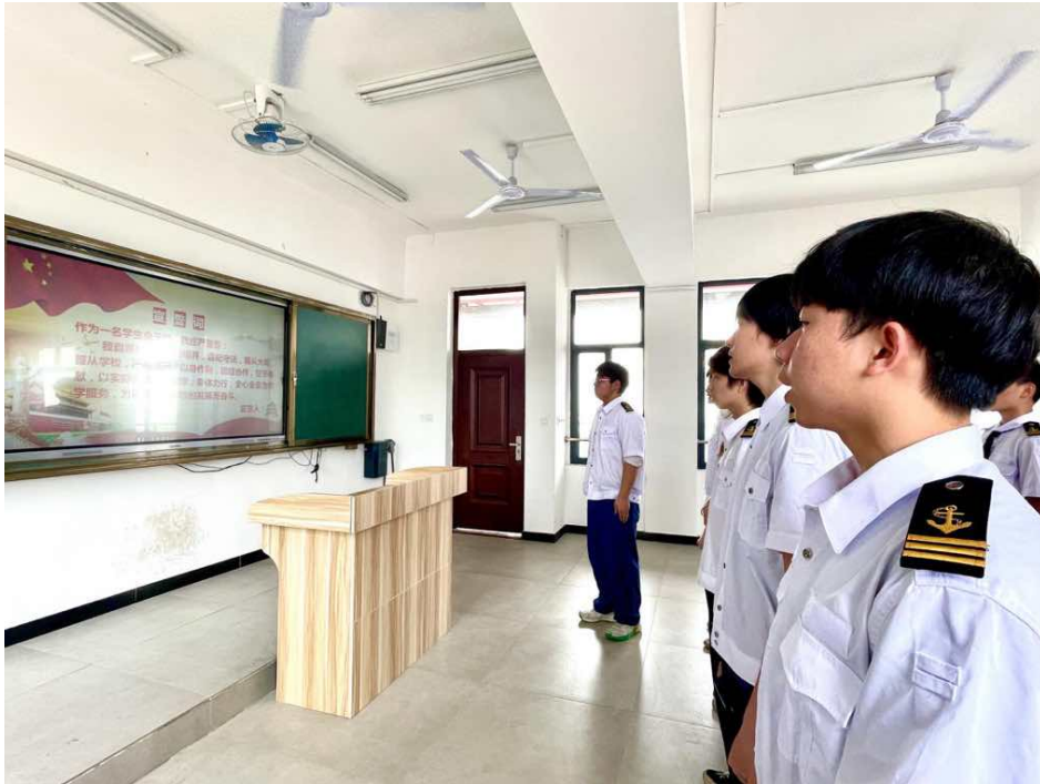
图 4：“续五四百年精神，扬航运团员风采”主题团日活动

组织学生团员收看庆祝中国共产主义青年团成立 100 周年庆祝大会，会后举行“建团百年，踔厉奋进”专题学习交流，回顾中国青年运动的百年历程，结合总书记重要讲话精神和自身学习工作实际开展讨论交流。与会学生团员纷纷表示要牢记党的嘱托，勇担青春使命，以青春之我，赓续百年芳华。