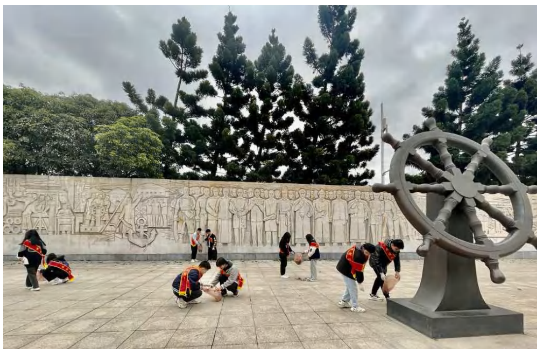
图 2：“船政少年学雷锋，点亮最美志愿红”活动

为纪念第 59 个“学雷锋”日，校团委组织开展“传承雷锋精神，船政少年在行动”系列活动。校团委组织志愿者前往“校门口的博物馆”——中国船政文化博物馆，开展“船政少年学雷锋，点亮最美志愿红”活动。通过除杂草、清垃圾等方式，美化环境，守护古迹，用实际行动学雷锋，弘扬“奉献、友爱、互助、进步”的志愿服务精神。校团委组织召开“雷锋精神永传承”分享会。介绍“雷锋纪念日”的由来，分享《雷锋日记》节选，志愿者们用亲身经历和大家交流参与志愿服务的点滴心得。活动结束后，同学们纷纷表示，雷锋的一生虽然短暂，但他无私奉献的精神却影响着一代又一代人。作为新时代的船政少年，要不忘初心，勇于奉献，在最美好的青春里留下无悔的奋斗足迹。