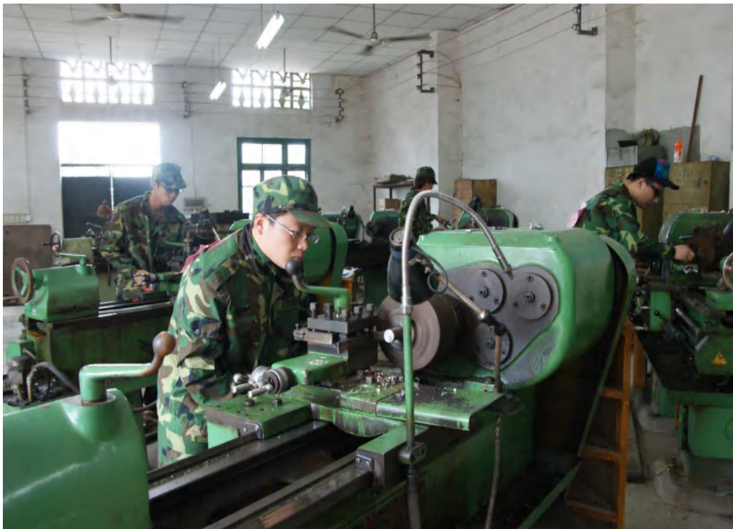
图 12：学生车工实作课