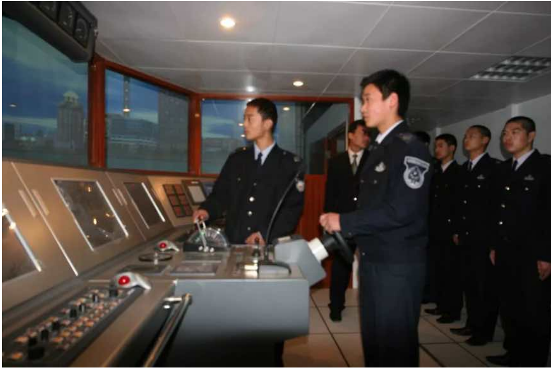
图 9：船舶驾驶专业学生专业课场景