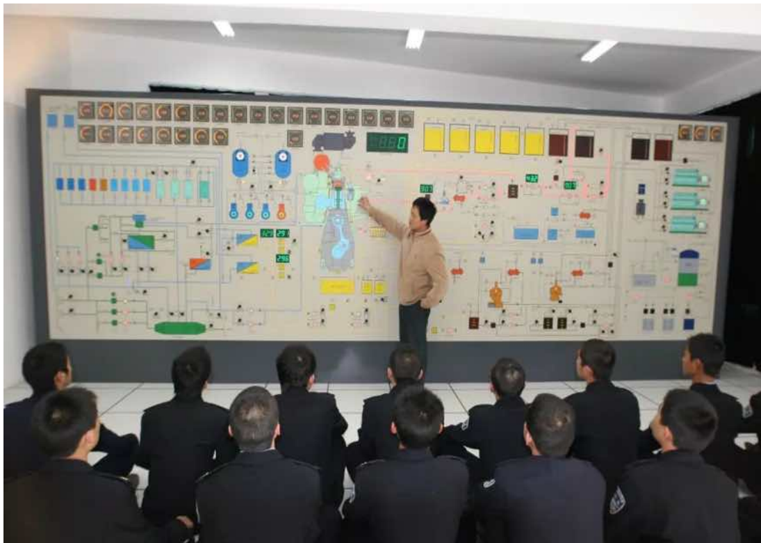
图 10：轮机维护与管理专业学生专业课场景