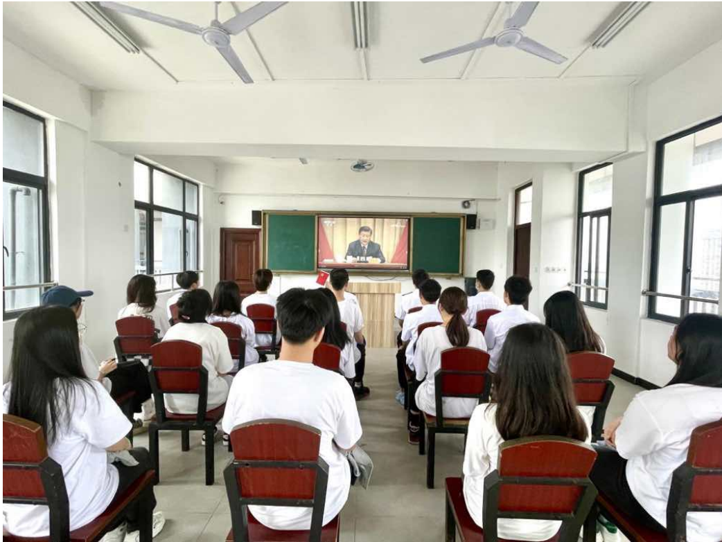
图 5：组织学生团员收看庆祝中国共产主义青年团成立 100 周年庆祝大会