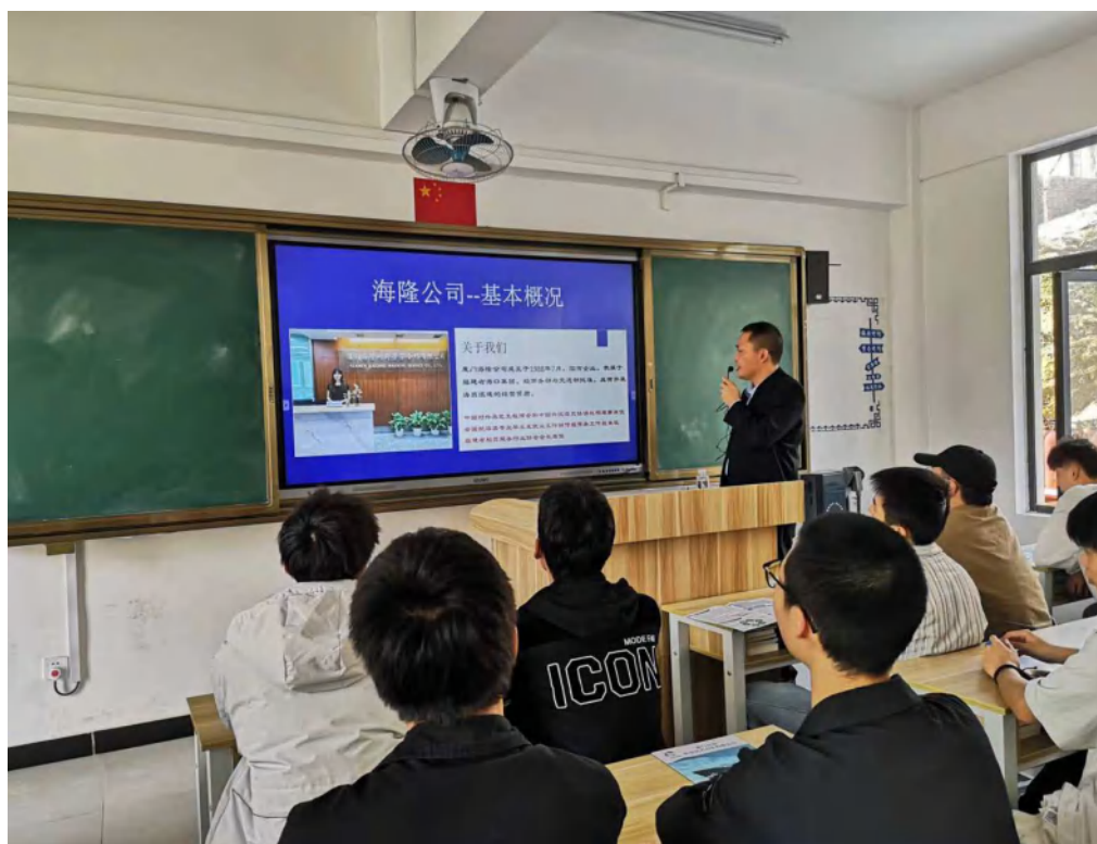
图 7: 厦门海隆对外劳务合作有限公司的就业推介会