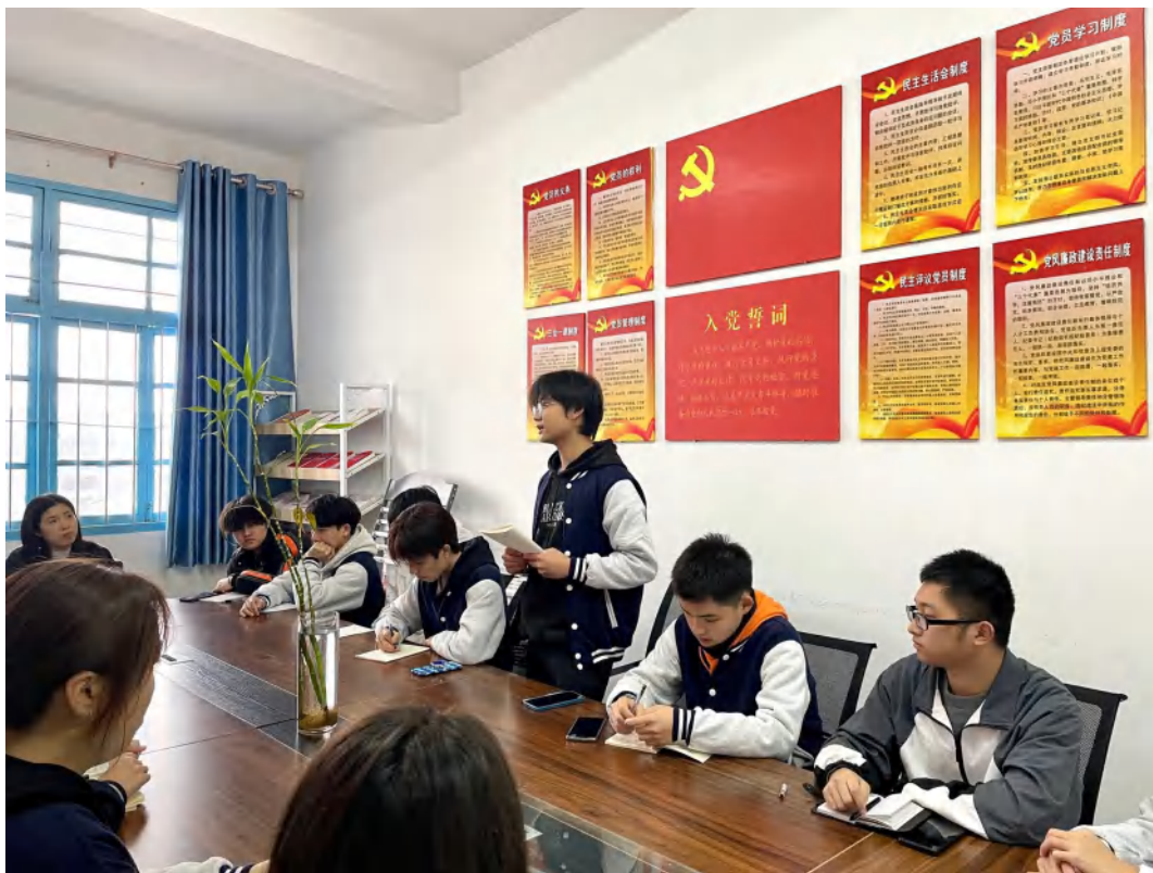
图 3：校团委组织召开“雷锋精神永传承”分享会