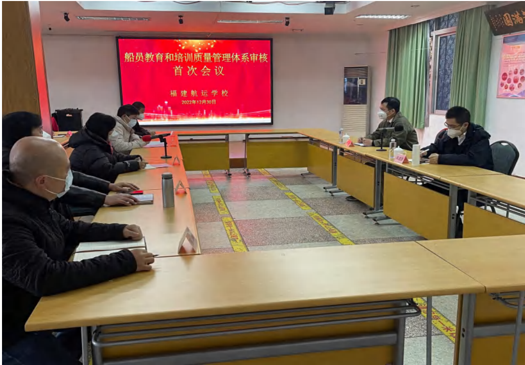
图 20: 质量管理体系审核组专家到校开展现场审核