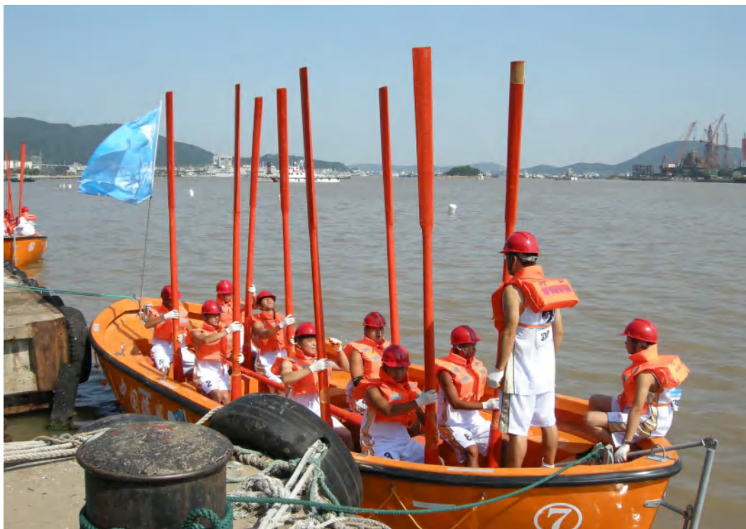
图 11：学生海上操艇训练