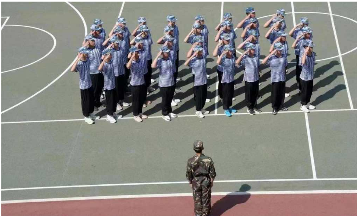
图 18：半军事化管理早操训练

半军事化管理就是我们现在所要遵守的规矩。这样的规矩让我们不再自由散漫，而是让我们有了更坚强的意志与更高昂的斗志！这样的规矩让我们不再以个人为中心，而是让我们凝成了一个团队，时时刻刻为团队的荣誉而奋斗！这样的规矩，让我们成为学校最独特的航海学校！