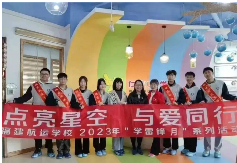
图 1：点亮星空，与爱同行——“学雷锋月”活动

寻着雷锋的脚步，开展了以“点亮星空、与爱同行”为主题的“学雷锋月”系列活动。以实际行动落实“深学争优、敢为争先、实干争效”活动部署，推动党的二十大精神在我校落地落实。