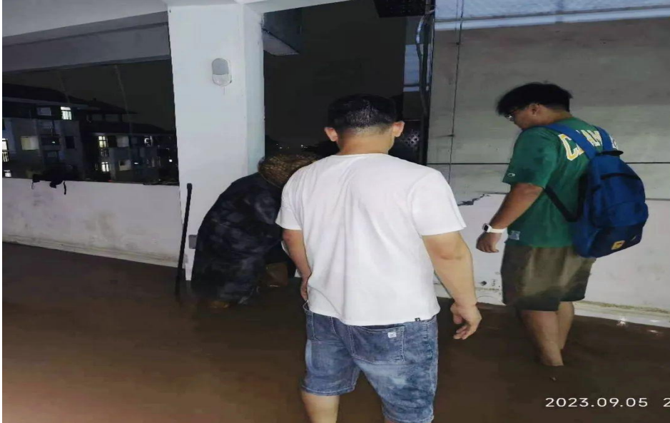
图 46：地下停车场现场勘察情况