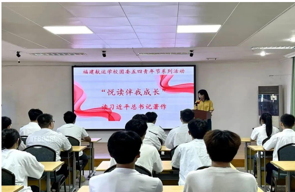
图 2：校团委组织开展“悦读伴我成长”——读习近平总书记著作活动