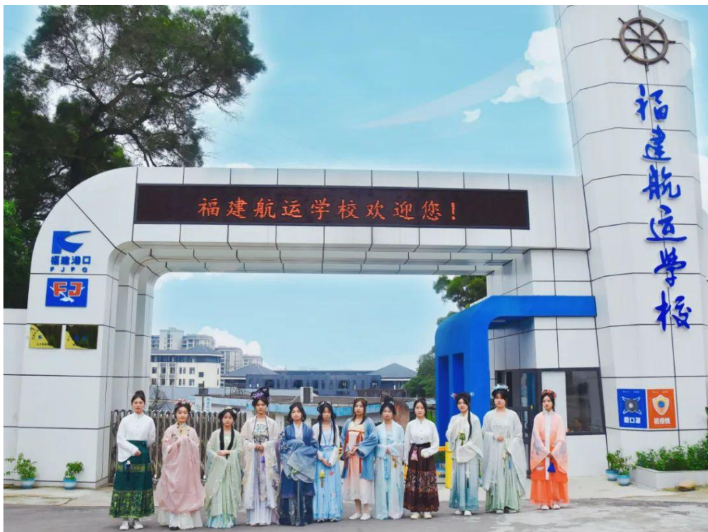
图 21：缠花社成员在校门口合影

一场别开生面的缠花展演和汉服秀在航校上演。缠花社成员戴上自己制作的精美的缠花发饰，拿着自己制作的团扇等缠花物品，穿上汉服校园漫步，进行缠花非遗文化宣传。