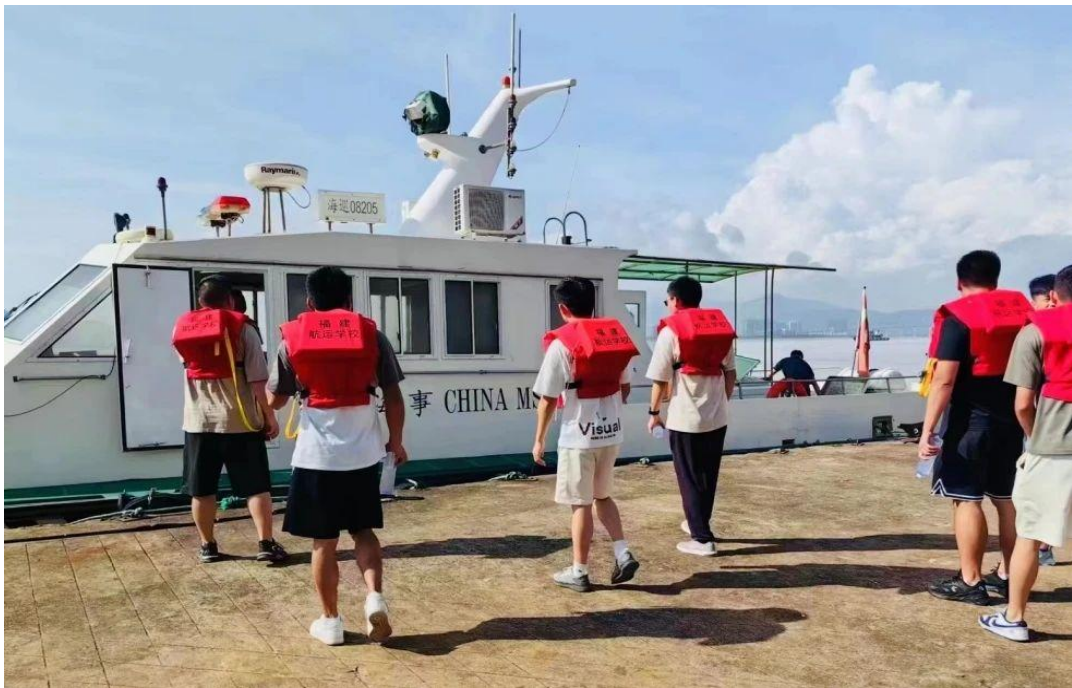
图 24：水上搜救综合应急演练现场 1

口航运枢纽水域船舶航行中突发险情为背景，联合开展了遇险人员疏散转移、伤病员救治、船舶消防、船舶拖带等多个险情应急处置科目。通过参与此次应急演练，航运学校将学习课堂前移至一线，积极变“演”为“练”，以“练”促“学”，将理论知识积极融入应急实战中。参演师生表示将继续扎实学习航海知识，积极为海洋经济高质量发展保驾护航。此次应急演练由福州海上搜救中心主办，旨在进一步贯彻落实习近平总书记关于安全生产和防汛救灾工作的重要指示精神，切实提升船舶应急处置实战能力。