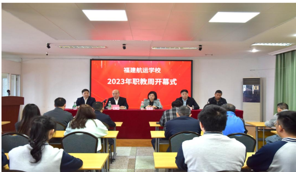
图 15：2023 年职教周开幕式

创造伟大”的时代风尚，推进技能型人才培养，更好地加强职业技能教育和专业建设、深化教育教学改革、展示办学成果，我校开展了年度校园职教周活动。全校师生充分准备、齐心协力，展示了我校职业教育发展新成果。