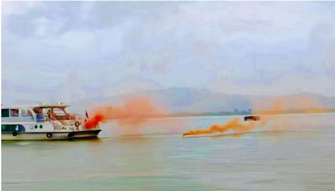
图 25：水上搜救综合应急演练现场 2