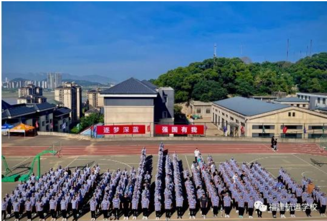
图 33：2023 级新生军训动员大会暨开营仪式