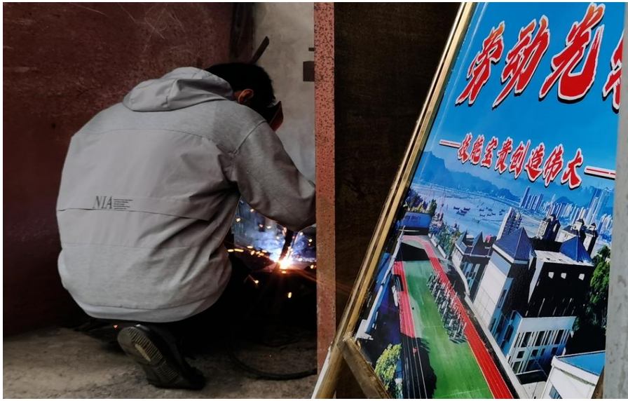
图 16：学生正在参加电焊技能大赛