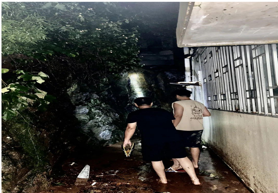
图 47：深夜紧急排查险情

后山发生山体滑坡，雨水裹挟落石泥沙损坏一座厕所，还直扑办公楼和涵元楼，地面瞬间一片狼籍。堵漏洞、转移重要资料、及时排