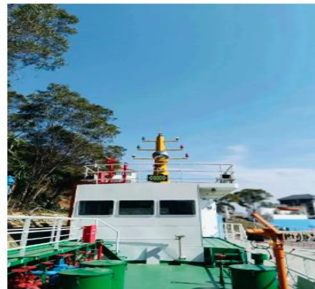
图 8：学校的油化高消实验舱