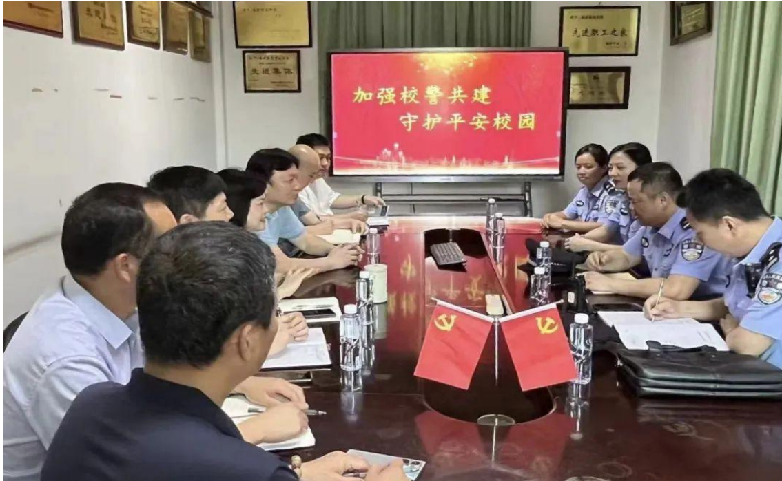
图 42：“加强校警共建、守护平安校园”座谈会

未来，学校和快安派出所将充分发挥“受理报警求助、落实防范措施、帮教矫正转化、排查化解矛盾、道德法治宣传”的“五进校园”职能，努力为广大师生营造良好的教育教学环境，使校园警务室真正成为师生身边的“保护神”。学校以全面提升建设平安校园的信心和能力，全力打造学生安心、家长放心、社会满意的美丽航校。