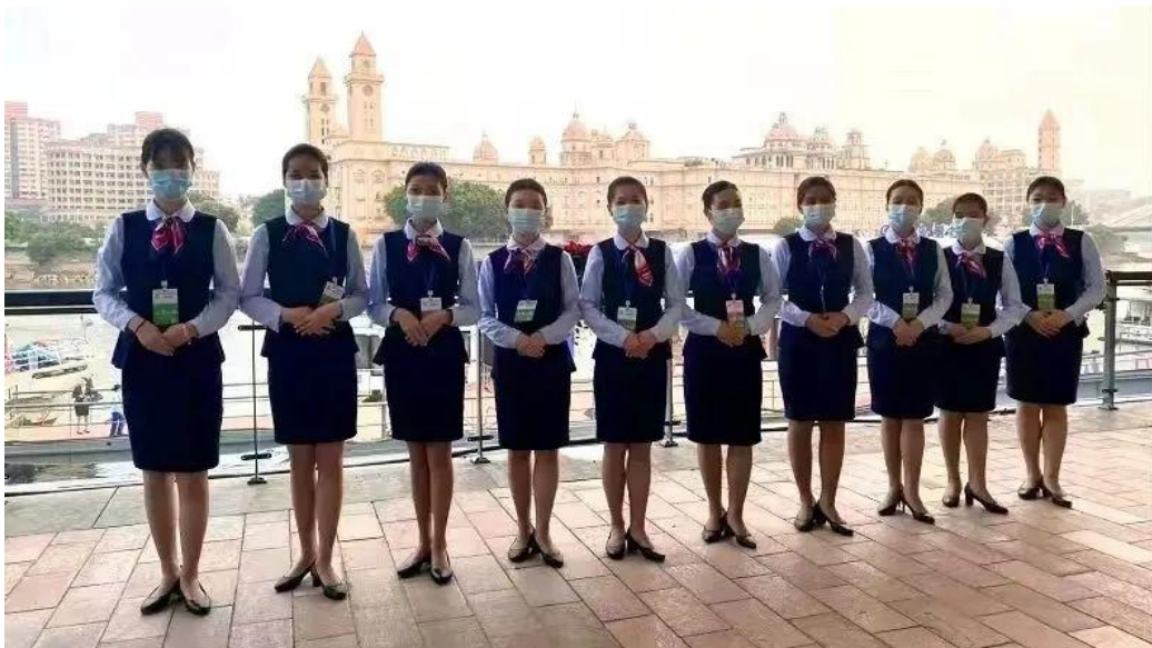
图 6：旅游专业学生参加重要接待任务

培养具有航海特色的面向旅行社、旅游景区、展览场馆、文博院馆、旅游信息咨询中心等行业，培养从事旅行社服务及其他旅游型企业服务工作的技能型人才。