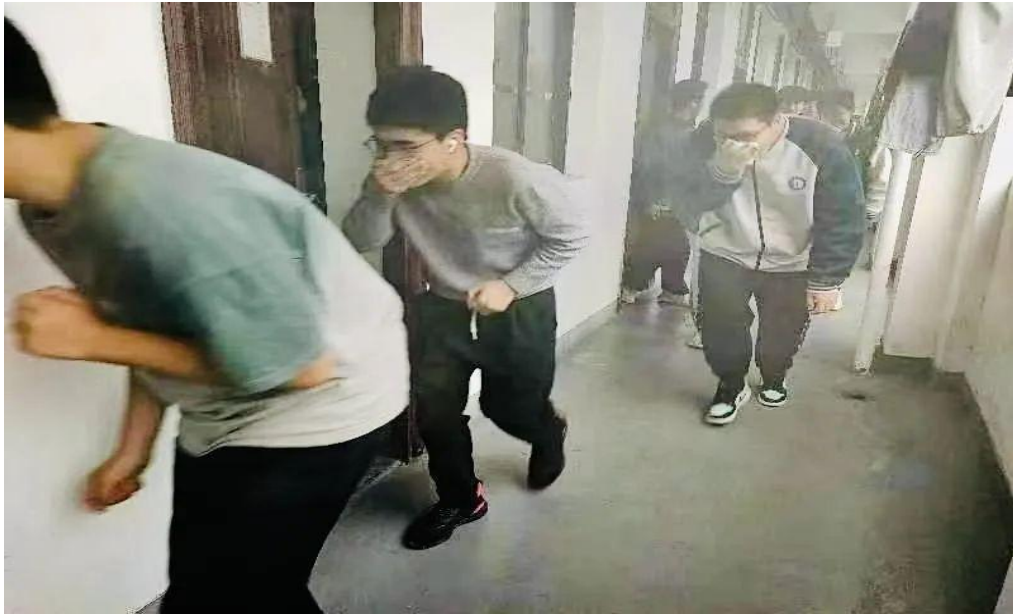
图 43：撤离疏散逃生现场