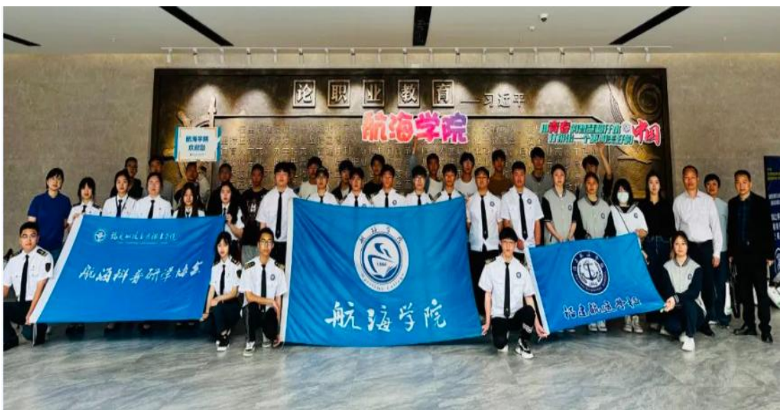
图 23：我校教师关心慰问升学的学生们

与兄弟院校福建船政交通职业学院航海学院就学生工作、职教升学与产教融合进行深入的交流。对我校升入航海学院的学生们的生活、学业表示关心、慰问，详细了解了他们的大专生活。学生代表们也十分感谢母校的关心，纷纷表示，航校三年的学习和生活为他们的人生指明方向，升入大专后，航校厚德、刻苦、重技的校训一直深深影响着他们。来到船政学院后，他们积极参与到学院各类活动中，成长为更加优秀的团学干部，同时牢记严谨治学的第一要务，争做一名优秀的海上人才。双方还就职业学校如何办出特色和水平、如何捋顺升学和就业的关系等进行了深入的探讨。