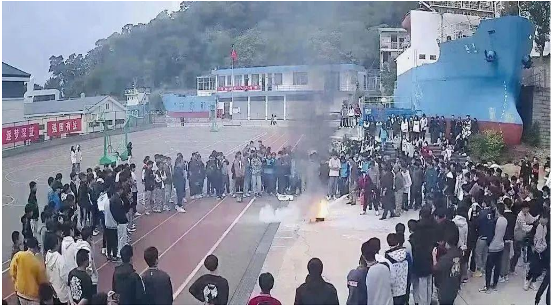
图 45：扑灭火灾的操作演练现场 2