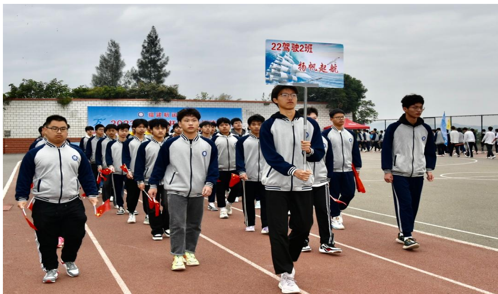
图 3：校运动会入场式