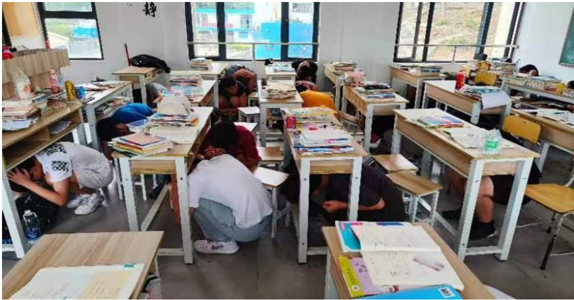
图 39：学生正在进行应急避险