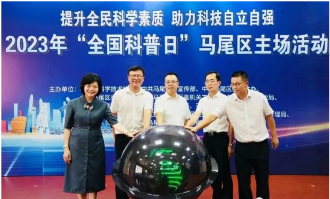
图 30：我校校长与众领导在 2023 年“全国科普日”马尾区主场活动现场合影

接触科学、感受科技魅力的机会，不仅增强了大家对科技发展的认识和兴趣，也为科普工作的持续开展注入新的动力。