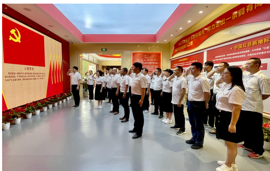
图 38：我校全体党员和入党积极分子进行入党宣誓

此次七一主题党日活动进一步强化了全体党员干部宗旨意识和使命担当。大家纷纷表示，在今后的工作中要立足岗位，苦干实干，以“久久为功”的冲劲，解决教育教学工作难题，提升育人智慧，确保主题教育走深走实，以工作实绩献礼党的 102 周年华诞。