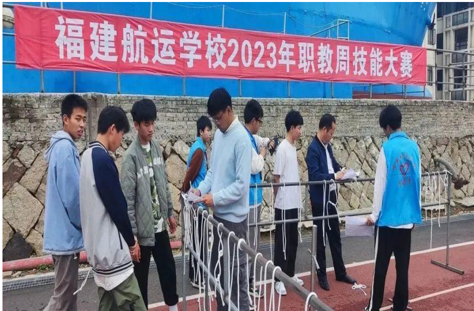
图 19：船舶驾驶专业学生参加绳结大赛