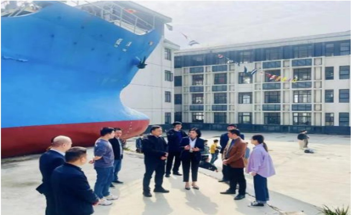
图 29：交通运输部东海航海保障中心和福州通信中心代表参观学校教学船、教学楼等设施