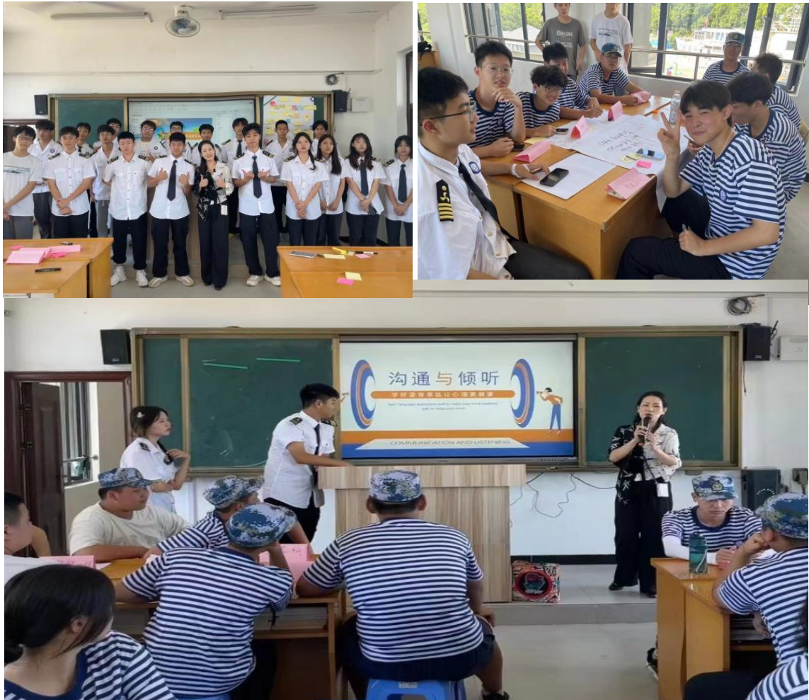
图 9：学生参加心理团辅活动

放松了身心，学会了积极沟通技巧，同时也锻炼了团队合作精神，使校园以德育人的氛围更加融洽和谐。