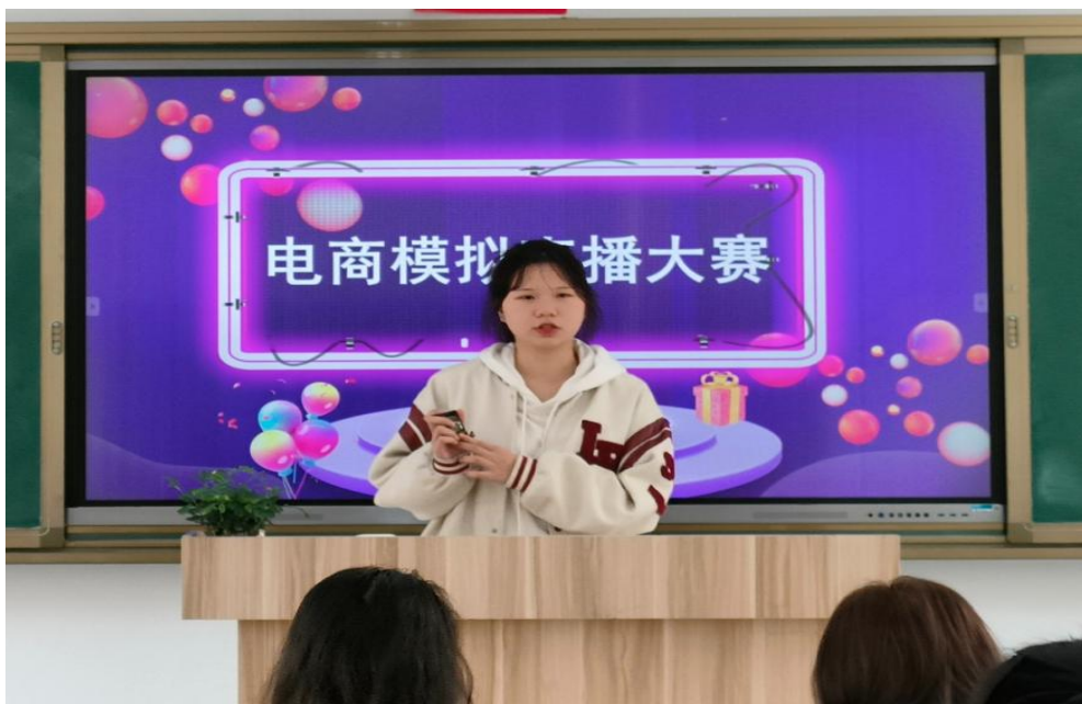
图 18：学生正在参加电商模拟直播大赛

此次活动主要面向电子商务专业的学生，结合当下电商营销热点，达到“以赛促学、以赛练技、以赛选才”的目的。参赛现场，学生们激情澎湃、妙语连珠，借助巧妙的设计、生动的语言、幽默的互动，对驱蚊手环、嗯嗯素、芒果干、洗面奶、素颜霜、手机壳、牛仔裤等进行了全面展示和推介。