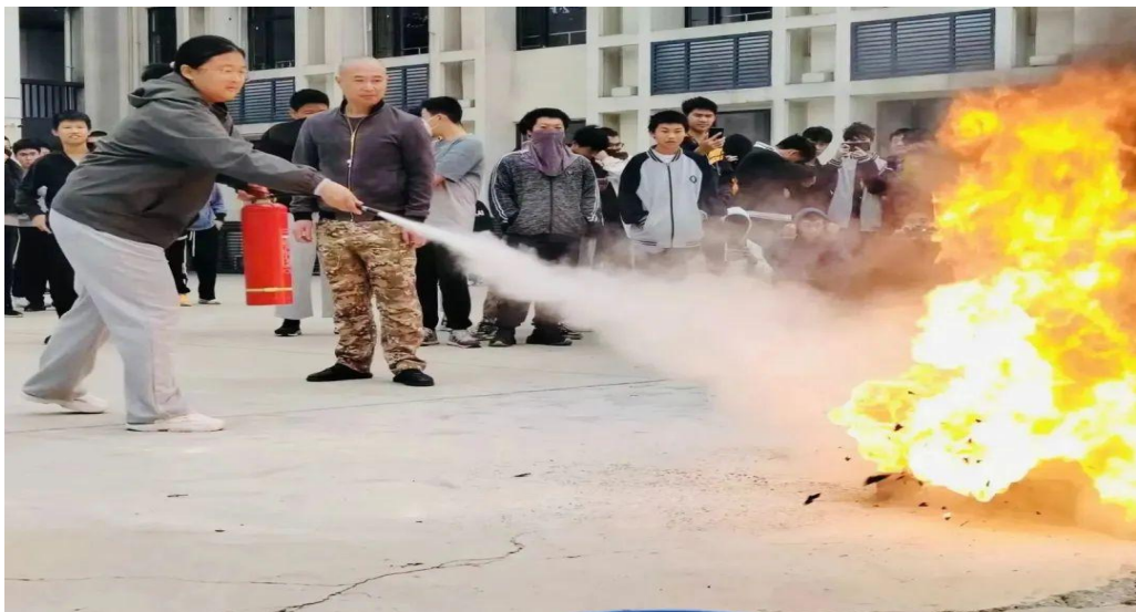
图 44：扑灭火灾的操作演练现场 1