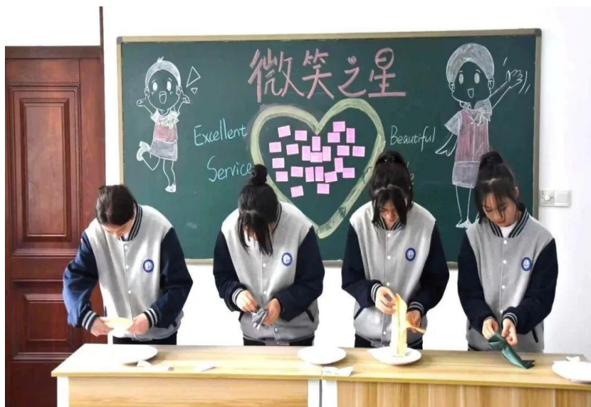
图 20：邮轮乘务和旅游专业学生参加微笑之星大赛

主要面向邮轮乘务和旅游专业学生，以“提升服务技能，增强服务意识”为主旨，结合学生实训实习的技能需求，设置多个环节，让学生们在口布花折叠中展示服务技能，在作品的命名和简介中发挥创意。