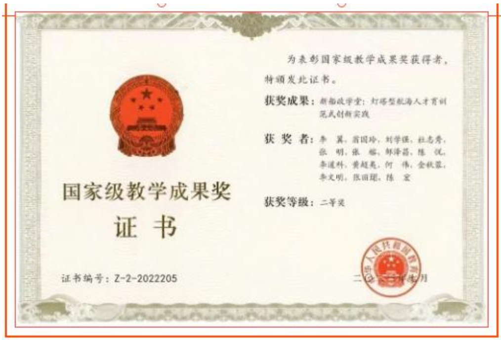
图 36：国家级教学成果奖证书