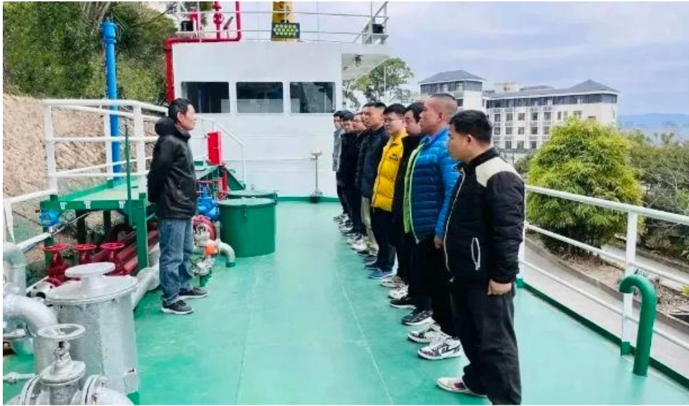
图 7：学员正在油化高消实验舱上课