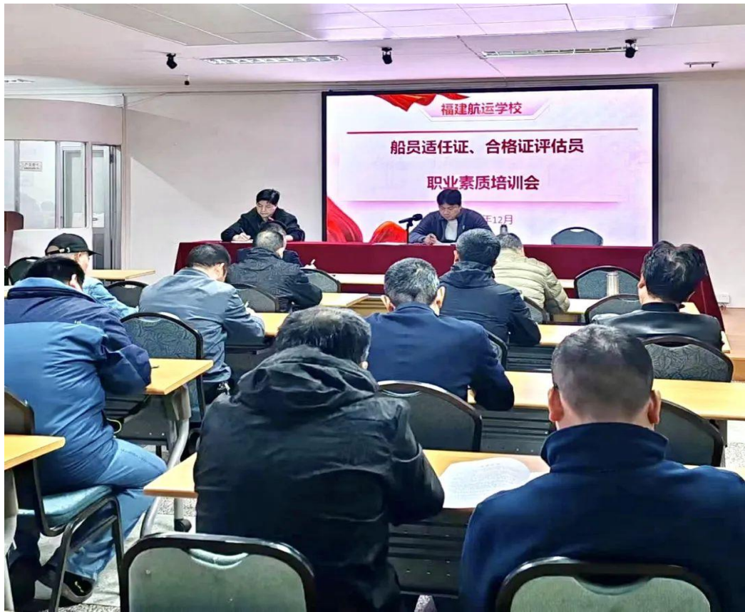
图 12：组织召开船员适任评估员职业素质培训会