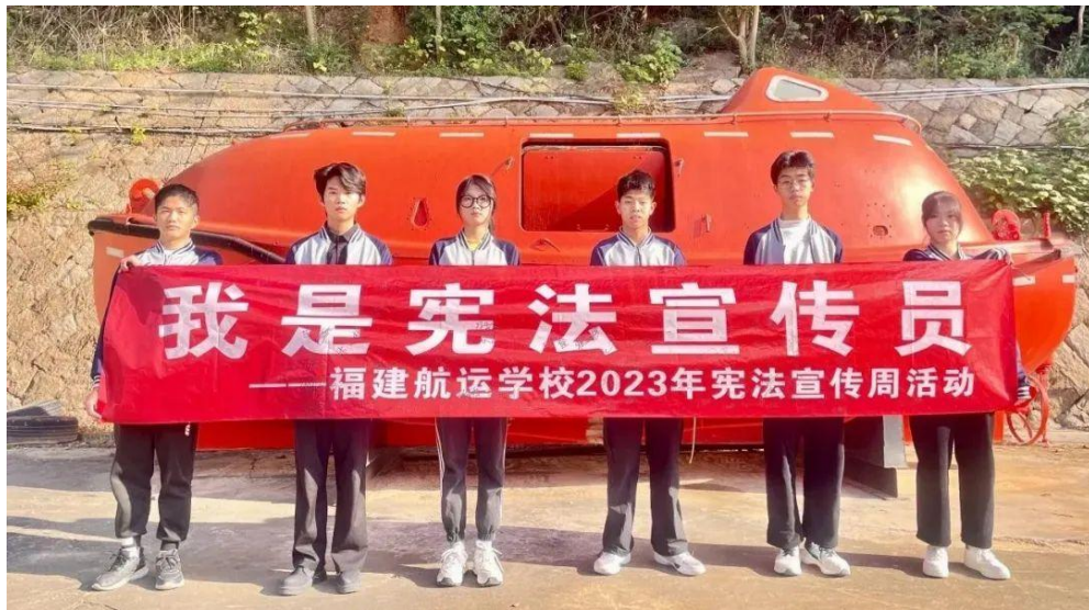
图 4：“宪法宣传周”主题活动