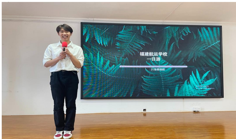
图 17：学生正在参加导游之星大赛

主要面向邮轮乘务和旅游专业，旨在展示学生风采，体现旅游文化魅力，为学生提供一个展现自我、发挥所学专业特色的舞台。比赛通过现场学生介绍自己的学校，以图片视频等多种形式，展现学生们语言表达和组织协调能力，让评委和听众们感受未来导游之星的独特魅力和风采。