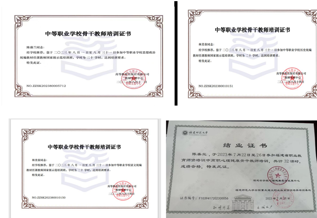
图 11：我校教师获得的培训证书、结业证书