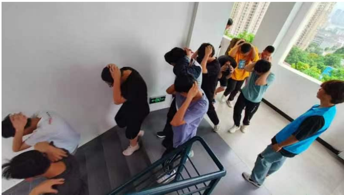
图 40：学生正在进行撤离疏散