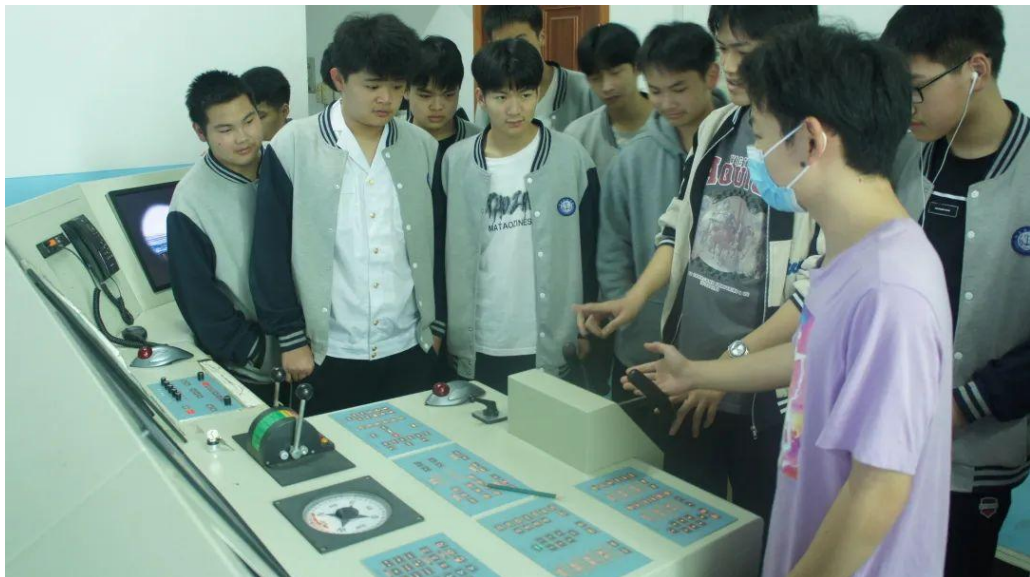
图 5：学生在操作驾驶台

培养国际海事组织要求的海船三副，海船水手，熟悉海上航行的规则，掌握船舶航行设备的应用，操纵船舶在海上安全航行。