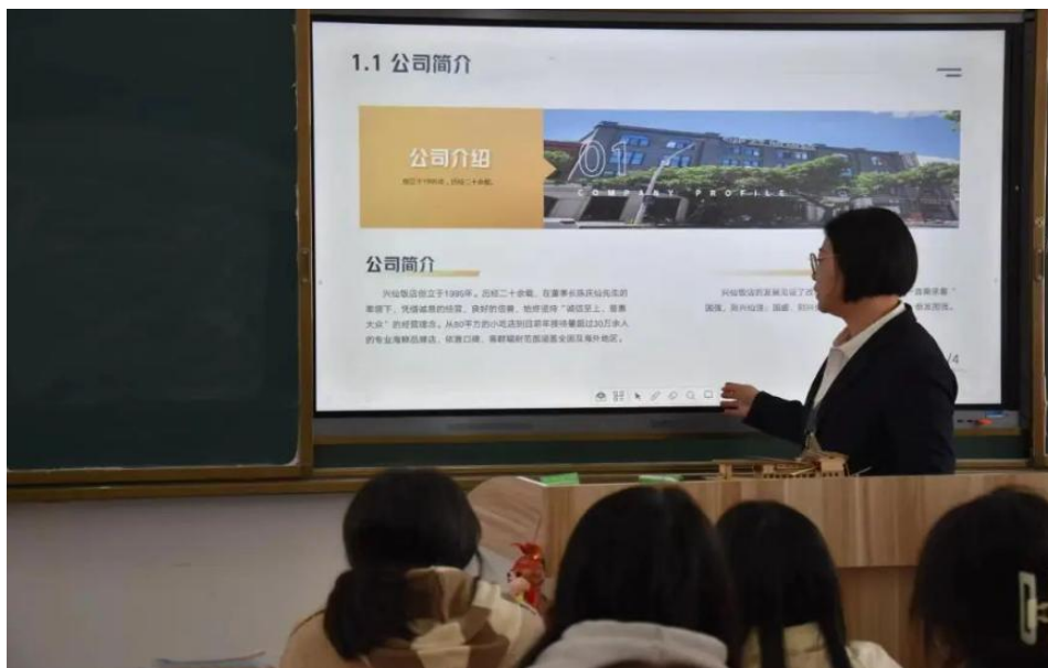
图 37：福建兴仙餐饮管理有限公司代表向同学们介绍公司

与我市知名餐饮企业——福建兴仙餐饮管理有限公司签订实习合作协议，这是我校积极探索与本地企业合作育人，为学生拓宽实习就业渠道，推动职业教育为地方经济社会发展服务的又一成果。“兴仙”作为福州的老字号餐饮品牌，主要经营实惠美味海鲜与福州特色美食，近年来运营稳健，规模稳步增长，由原来马尾区总店，已向福州其他地区拓展，近期又有两家分店已基本完成开业筹备工作。为更好地组织实施 2023 年学生实习工作，加强校企合作，校领导已带领教务、生管等部门的主要负责人对该企业进行了实习合作单位的实地考察与调研。兴仙餐饮公司也派出人员来到我校进行实习宣讲，向学生们介绍了人才需求、薪资待遇和发展规划，并回答了学生们提出的相关问题。